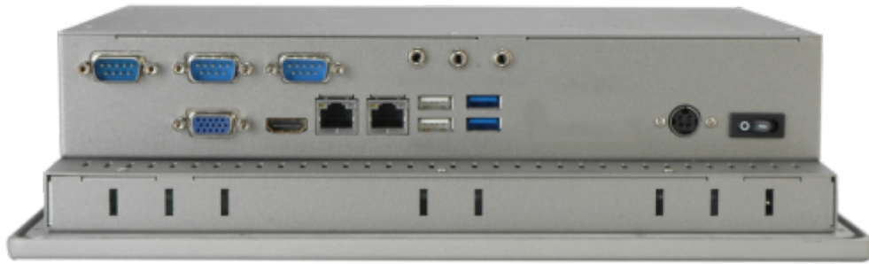
PPC-3708A Panel PC I/O