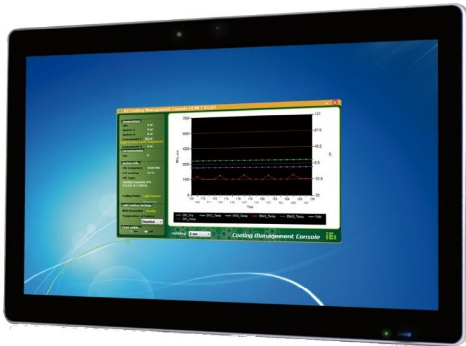
AFL2-W21-H61 Panel PC Ohne LED BAR