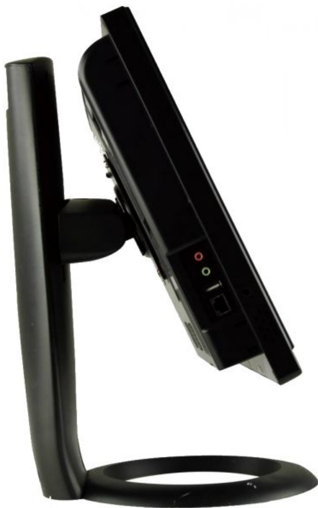
AFL2-W15B-H61 Panel PC