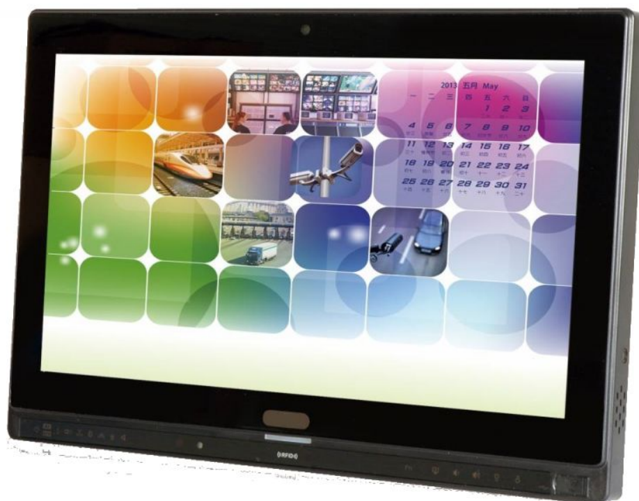
AFL2-W15B-H61 Panel PC