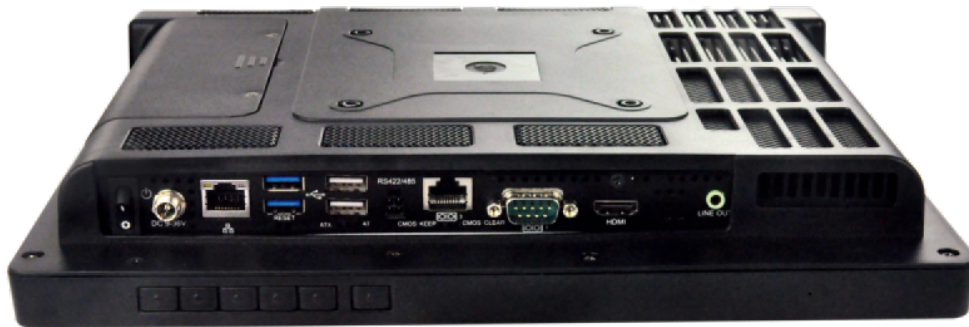
AFL2-12A-HM65 Panel PCs I/O