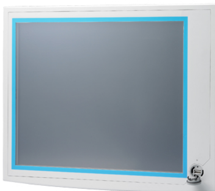
IPPC-6192A Panel PC Frontansicht