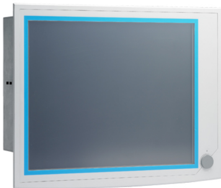
IPPC-6192A Panel PC Frontansicht