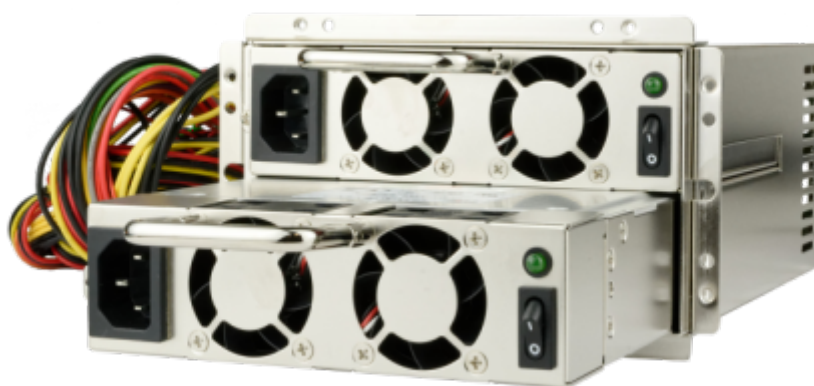
MRW-5450V4V Netzteil Modul

ABECO Industrie Computer GmbH Industriestraße 2 47638 Straelen Deutschland