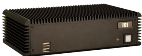
ECW-281B / B2-D525