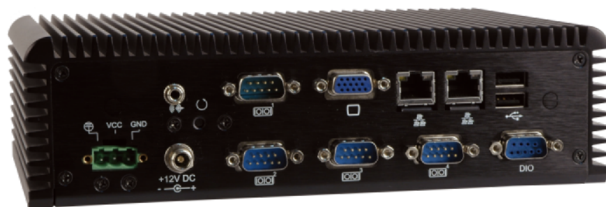
ECW-281B/D2550 Embedded Box PC I/O