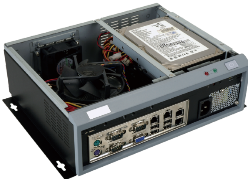
ebc-3000 Innenansicht mit HDD und itx Board