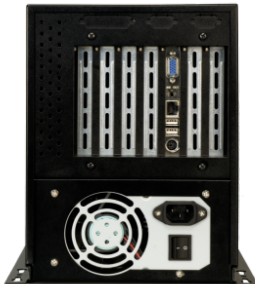
PAC-1700G Gehäuse Rückseite