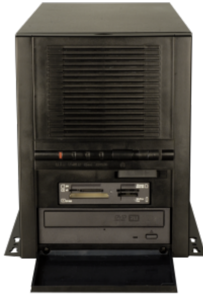
PAC-1700G Gehäuse Front