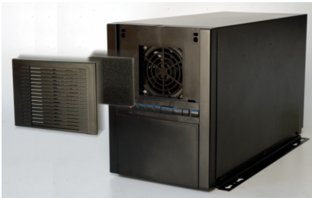
PAC-1700G Gehäuse Filter