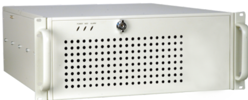
RACK-3000G Gehäuse weiß