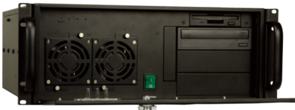
RACK-3000G Gehäuse Tür offen