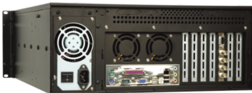
RACK-3000G Gehäuse Rückseite