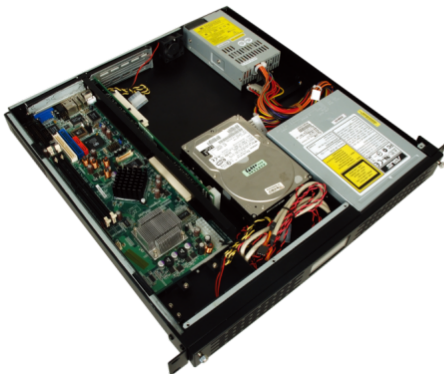
RACK-1150G/1150G-PE Gehäuse offen