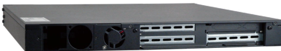
RACK-1150G/1150G-PE Gehäuse Rückseite